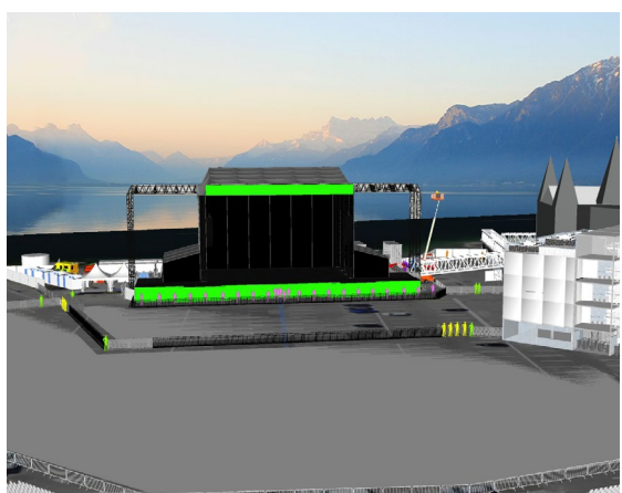
Scène de la Place du Marché