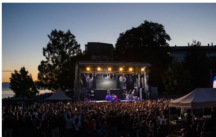
La scène du Jardin du Rivage lors de la 1 ère édition